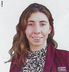
PAR KETSIA CROTEAU Conseillère pour le territoire Ouest

Ces producteurs « crinqués », comme ils aiment bien se décrire eux-mêmes, ont toujours eu la passion pour le métier gravé sur le cœur et maintenant ils porteront fièrement le bouclier de Maître-éleveur. C'est sans aucun doute grâce au travail de toute la famille que le troupeau Coti est désormais Maître-éleveur. Aujourd'hui, ils sont fiers de ce qu'ils ont pu accomplir et aimeraient être de retour pour un deuxième titre! Bienvenue dans la grande famille des Maîtres-éleveurs! ■